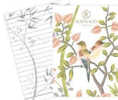
パラダイスシリーズ オリジナルノートブック