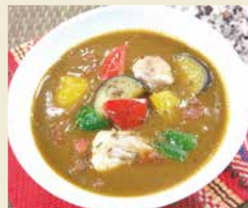
調理例：野菜カレー

POINT ①焦がさないように注意すること ②数種類のスパイスをテンパリングする際は、かためのスパイスから順番に入れること