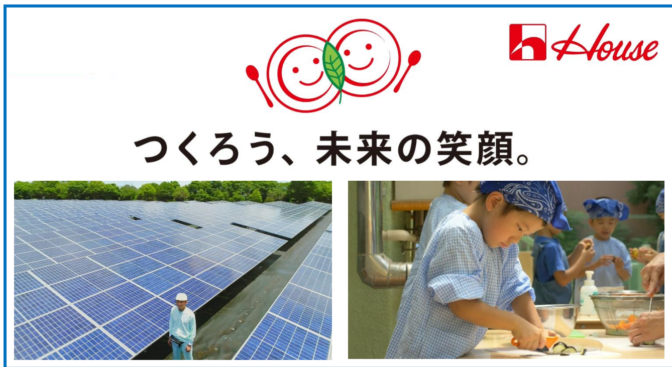
(画像左) CO 2 排出削減の取り組み篇：ハウス食品静岡工場の太陽光パネル

「つくろう、未来の笑顔。」サイトURL: https://housefoods-group.com/activity/smilefuture/index.html