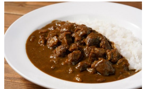
新製品「お客様の夢実現 とうろま牛角煮カレー」（調理例）