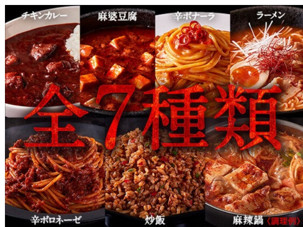
しあわせの激辛 7種セット