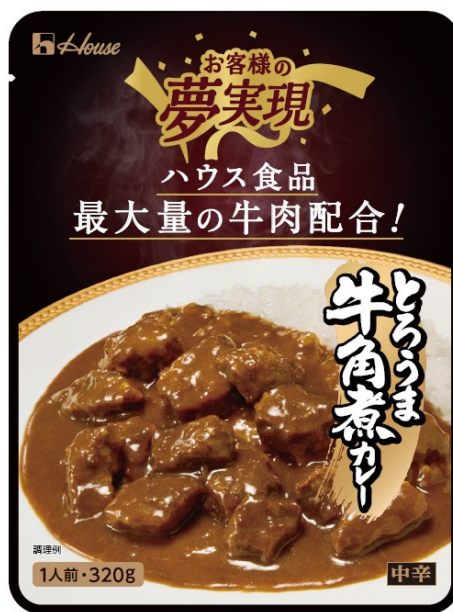
新製品「お客様の夢実現 とろうま牛角煮カレー」