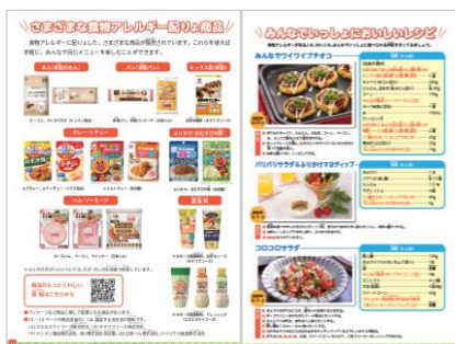
『さまざまな食物アレルギー配慮商品』の頁

同年代のキャラクターが登場し、マンガやイラストを交えてわかりやすく解説する内容は、好評をいただいています。