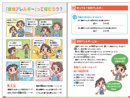
『食物アレルギー』って何だろう？』の頁