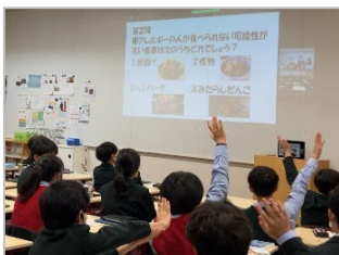
【クイズで楽しみながら学習】