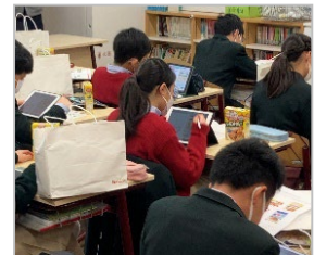
【ワークに取り組む様子】