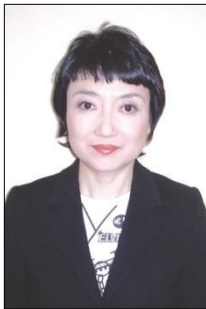
食空間プロデューサー ア・ラ・ターブル 代表

フランスより帰国後、各種学校の講師を経て'00年ア・ラ・ターブル設立。レイノーのアドバイザーとして、テーブルウェアフェスティバルはじめ、イベントやブライダルのデコレーション、講演会講師等を務める。