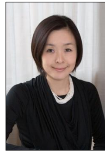
インテリアスタイリスト ㈱デコール 代表

家庭画報など婦人誌のインテリアページをはじめ、CM、ショールームのディスプレイ、数々の料理本のスタイリングも手がける。エレガントで都会的なコーディネートに定評がある。