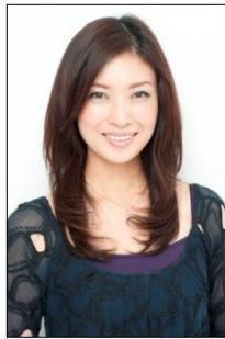
食空間プロデューサー ㈱ダイニングアンドスタイル代表

食に関する店舗プロデュース、コンサルティング、セミナー講師、商品開発、レシピ提案、イベントディスプレイなど幅広く手掛けるほか、さまざまなメディアを通じてつねに新しいライフスタイルを発信。